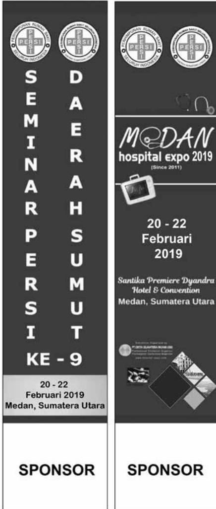
Umbul-Umbul Versi 1 (Logo Sponsor: 1Mx1M)